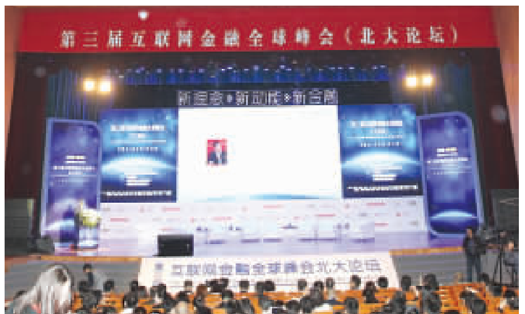
图为峰会论坛现场。

中国人民银行科技司副司长陆书春表示,建立良好的互联网金融发展的生态环境,有三个方面的难题需要破解。一是从互联网企业的角度来看整个行业的发展所面临的风险和挑战。互联网金融在发展过程中面临信用风险、市场风险、操作风险、流动性风险和法律风险等一系列的风险考验,从业机构普遍的风控经验和能力与传统机构还有差距。二是从互联网金融监管角度看,互联网金融监管缺少数据支撑。当前互联网金融统计监测体系正在逐步健全,各级监管部门也还无法全面掌握行业底数,难以及时预判风险。三是从互联网金融投资者的角度来看,风险防范意识不够,一方面容易轻信高收益的宣传,另一方面承受风险能力也较低。 >>>05